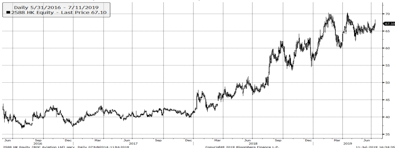
圖 3：中銀航空租賃股價圖（截止 2019 年 7 月 11 日收市價）